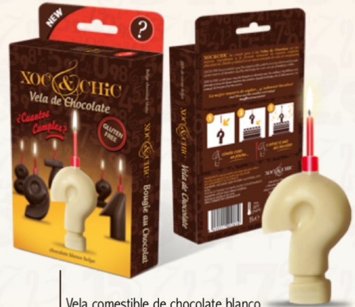
Vela comestible de chocolate blanco Interrogante