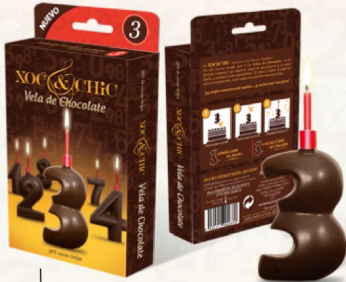
Velas comestibles de chocolate negro Chocolate belga Números del 0 al 9