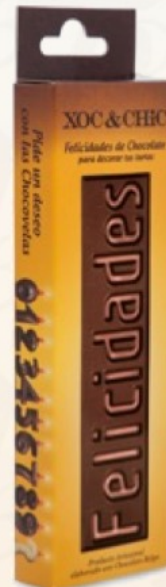
Tableta de chocolate negro Chocolate belga Felicidades